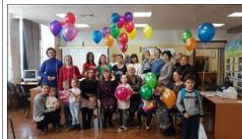
День любви, семьи и верности Для жителей мкр "Северный" проведен семейный праздник, как открытие семейного клуба