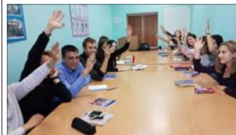
Тренинги "Семейный коучинг" Кто за успешное построение жизненной стратегии?