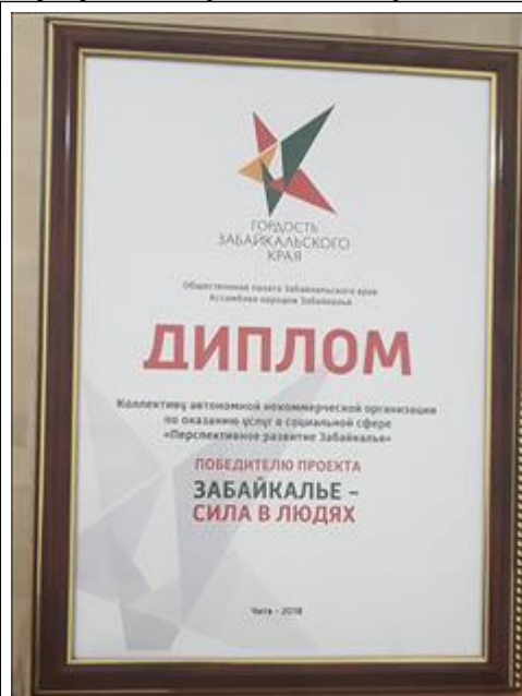
Гордость Забайкальского края Общественная палата поздравила коллектив.