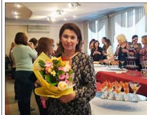
Торжественное открытие Центра сохранения семьи Торжественное открытие Центра сохранения семьи