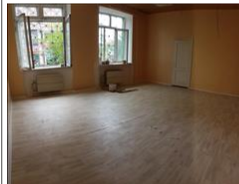
Помещение Центра после ремонта Помещение Центра после ремонта. Адрес: г. Чита, ул. Бутина, 73