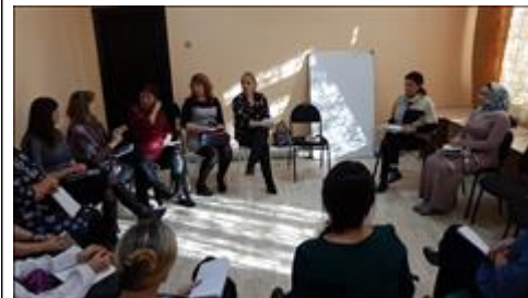
Тренинги "Семейный коучинг" Возраст и одиночество - не приговор. Построение стратегии успешной жизни и поиска партнера.