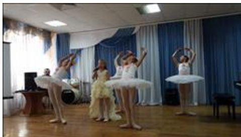
День любви, семьи и верности Для жителей мкр "Северный" проведен семейный праздник, как открытие семейного клуба