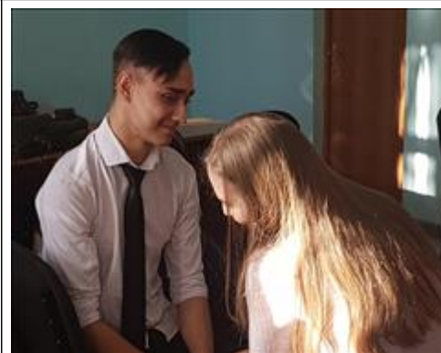
Семейная медиация Грамотное разрешение семейных конфликтов