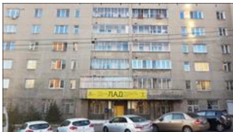
Вход в Центр сохранения семьи Вход в Центр сохранения семьи после ремонта

Информация, указанная Вами в данном поле отчета, будет доступна для посетителей сайта Фонда президентских грантов (в том числе представителей СМИ)