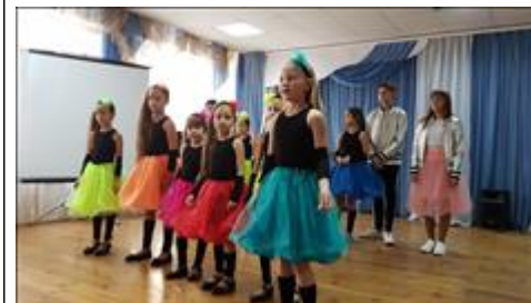
День любви, семьи и верности Для жителей мкр "Северный" проведен семейный праздник, как открытие семейного клуба

https://www.facebook.com/chitacss/videos/2032718950111453/?modal=admin_todo_tour