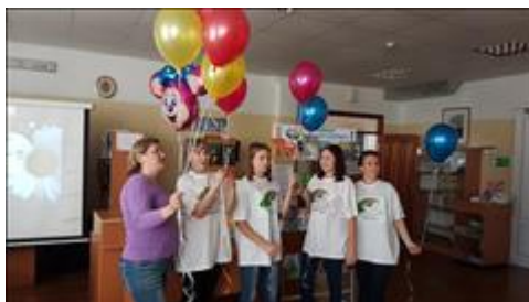
День любви, семьи и верности Для жителей мкр "Северный" проведен семейный праздник, как открытие семейного клуба