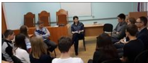
Тренинги по семейной медиации Успешное разрешение конфликтов - незаменимый навык в семейной жизни.