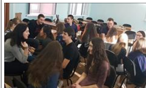
Тренинги "Семейный коучинг" Совместное построение успешной жизненной стратегии