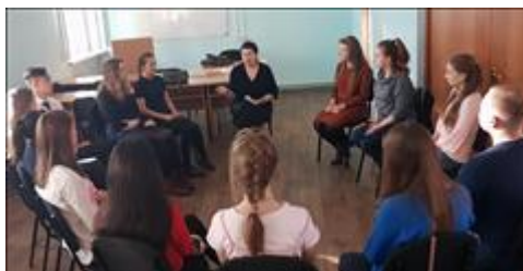
Тренинги "Семейный коучинг" Совместное построение успешной семейной жизни.