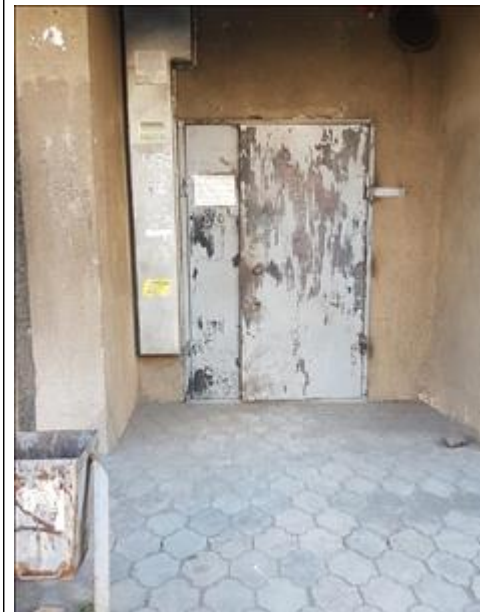
Вход в Центр сохранения семьи Вход в Центр сохранения семьи до ремонта