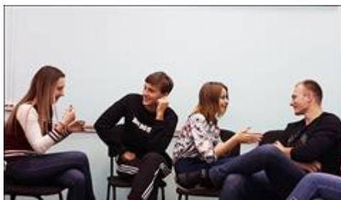
Тренинги "Семейный коучинг" Совместное построение успешной жизненной стратегии