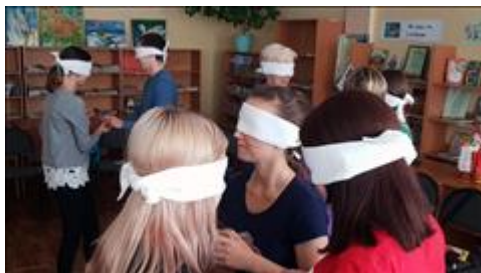
Тренинги "Психология семейной жизни" ПЗГ - практики закрытых глаз. Великолепный тренинг, включающий и обостряющий чувства.