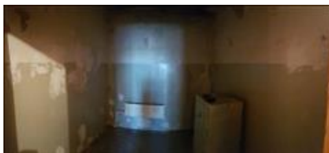
Помещение Центра до ремонта Помещение Центра до ремонта. Местонахождение - г. Чита, ул. Бутина, 73